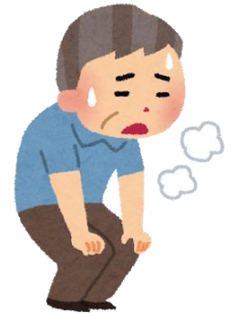
強い息切れ 痰(たん)の症状