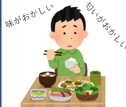
味覚異常 嗅覚異常